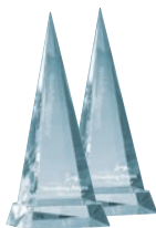
2 x Ausbildungspreis Landkreis Straubing-Bogen